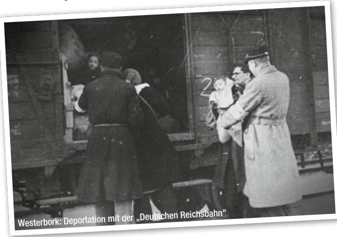
Westerbork: Deportation mit der „Deutschen Reichsbahn“

Die Züge, die vor 70 Jahren durch Deutschland fuhren, hätten gestoppt werden können, und die Kinder könnten leben – wenn Rassismus und nationalistischer Größenwahn auf entschlossenen Widerstand gestoßen wären.